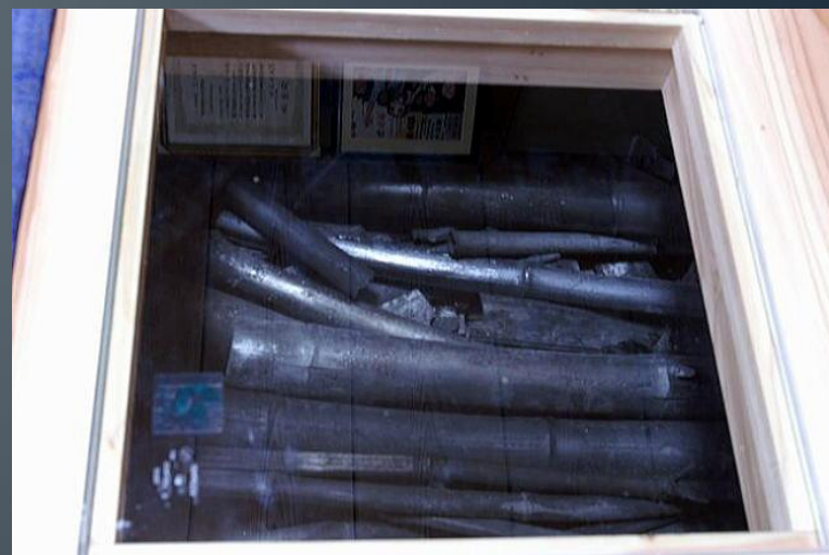
多摩産材でリホームした居間と床下には、DAIGOエコロジー村で焼いた竹炭を敷き詰めています。床下が見れます。